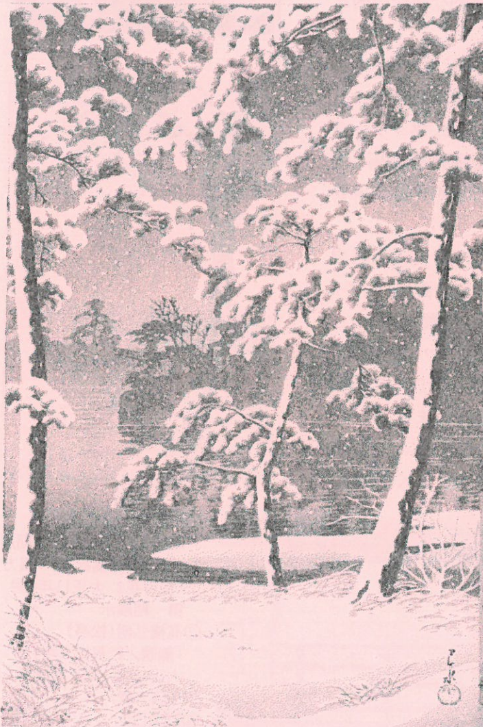
川瀬巴水「千束池」『東京二十景』昭和3年作