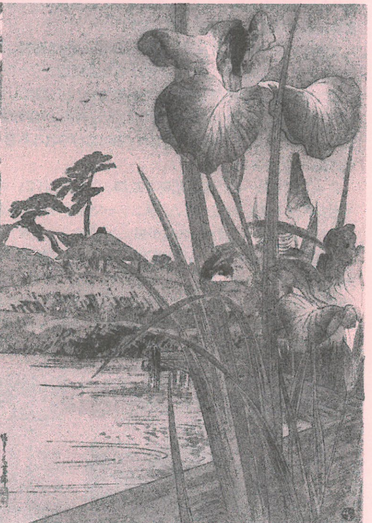
高橋松亭「堀きり花菖蒲」明治42年～大正5年(個人蔵)